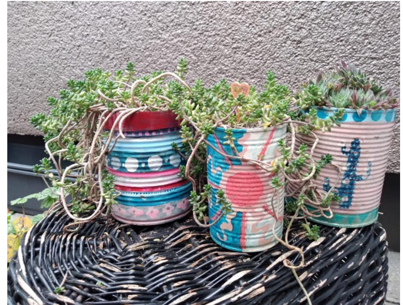
K. Uhlirsch / BUND-KV S