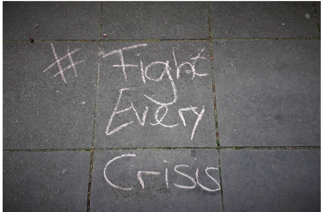
Fight every Crises (Theresa Thiemeier / BUND-KV S)