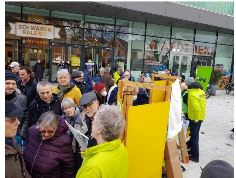
Auftakt des einjährigen Projekts Energiewende-Offensive in Stuttgarts Stadtteilen.