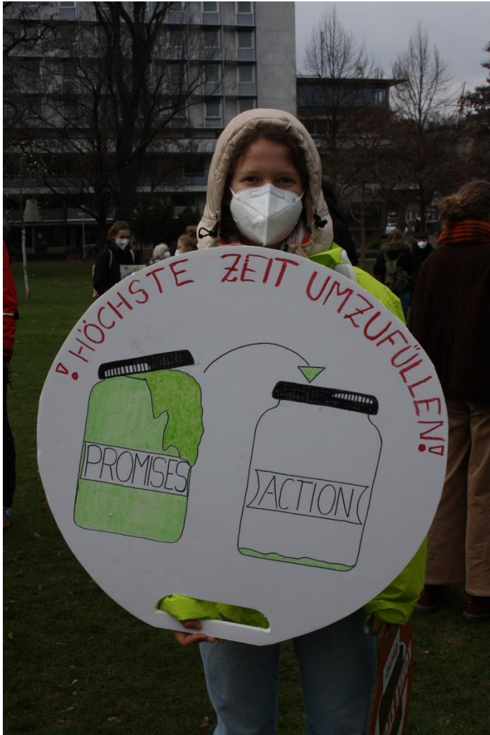
Höchste Zeit umzufüllen