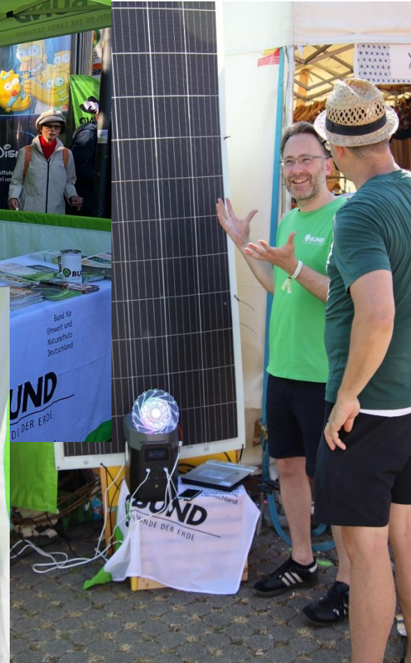
Impressionen von verschiedenen Veranstaltungen (BUND-KV S)