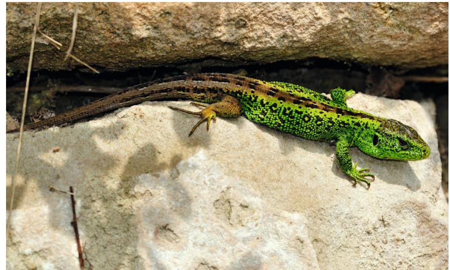
Zauneidechse auf Trockenmauer