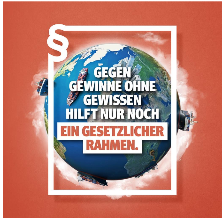
Lieferkettengesetz – Allgemeines Motiv (BUND-KV S)