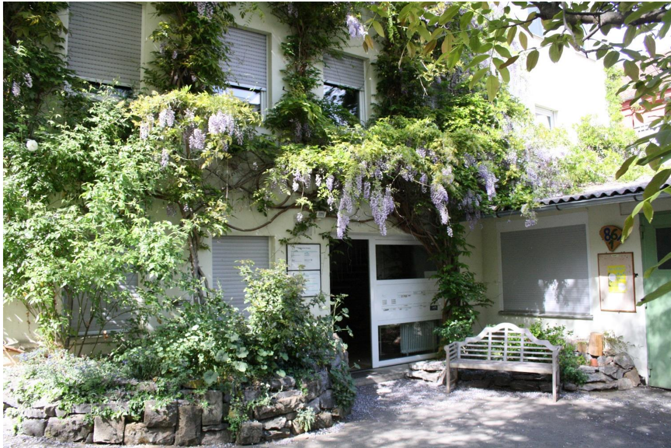
Das Umweltzentrum (BUND-KV S)