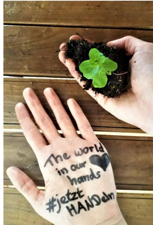
The World in our Hands