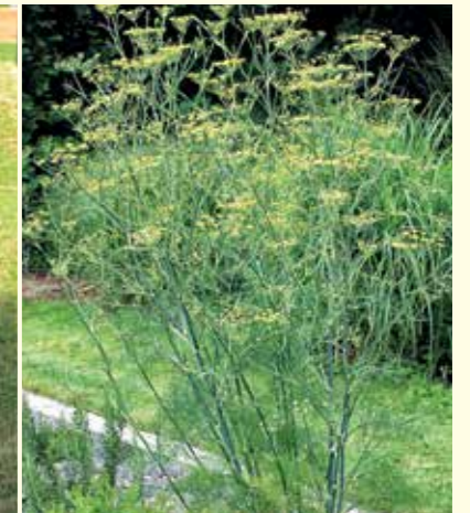
Abbildung 18: Mit Blüte- und Fruchtstand schmückt Fenchel (Foeniculum vulgare) das Duft- und Aromabeet.

Trachtlücken, die vor allem im zeitigen Frühjahr und im Spätsommer auftreten, entschärft werden. Beliebte Sommerblüher, die gerne von Bienen aufgesucht werden, sind Lavendel (Lavandula angustifolia), Katzenminze (Nepeta cataria) oder auch die Wiesenschafgarbe (Achillea millefolium), die sich für naturnahe Pflanzungen gut eignet. Im Frühjahr bzw. Frühsommer bereichern das Berg-Steinkraut (Alyssum montanum), Rosmarin (Rosmarinus officinalis) und der Echte Salbei (Salvia officinalis) das Pollen- und Nektarangebot. Davon profitieren auch Wildbienen wie z. B. die Garten-Hummel (Bombus hortorum). Eine beson-