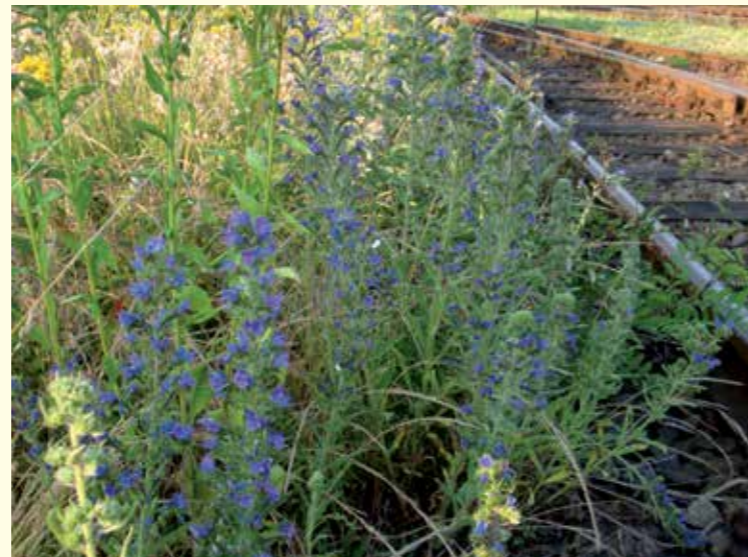
Abbildung 1 oben: Männchen der 1 cm großen Spargel-Sandbiene ( Andrena chrysope ) auf einer Blüte von wildwachsendem Spargel ( Asparagus officinalis ). Dieser blüht in Übereinstimmung mit der genetisch fixierten Flugzeit der Spargelbiene und nicht wie der Kulturspargel vier Wochen später.