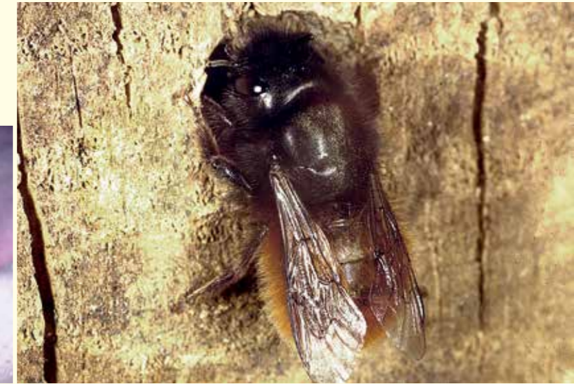
Abbildung 4 oben: Die Rotklee-Sandbiene ( Andrena labialis , Körperlänge 12 mm) am Eingang ihres Bodennests.