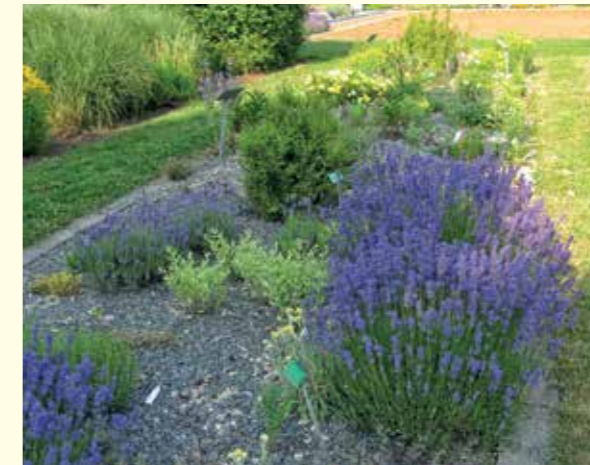
Abbildung 17: Bienenweide, Gewürz und Schmuck bis zum ersten Frost: Blühender Lavendel (Lavandula angustifolia) im Duft- und Aromabeet.

Trockene, sonnige Ecken im Garten bieten sich für die Anlage eines Duft- und Aromabeetes an (Abbildung 17 und Abbildung 18). Die Vielfalt an Düften und Aromen der „Duftpflanzen“ dienen dem eigenen Wohlbefinden und helfen den Bienen. Wird der Blühtermin der Arten bei der Auswahl berücksichtigt, können