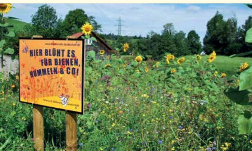
Abbildung 11: Imagegewinn für die Landwirtschaft durch Kommunikation

Im Zusammenhang mit der Erforschung nachwachsender Rohstoffe und mit Blick auf die Flächenproduktivität sowie einer Ökologisierung des Anbaus wird jedoch wieder intensiver an diesem Thema gearbeitet.